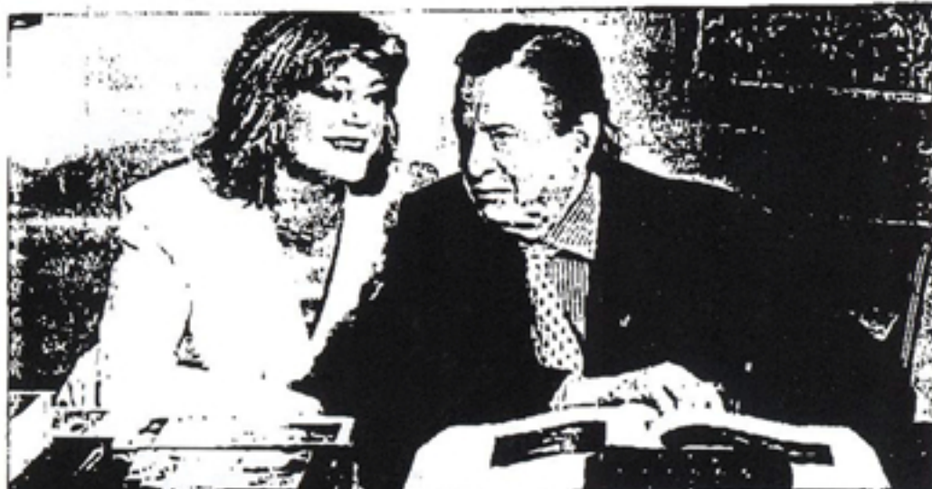
¿Qué compraron los Thyssen en ese ARCO triunfal para casi todos? Para Antonio de Felipe, que vació el Prado de vaquitas felices, desde luego